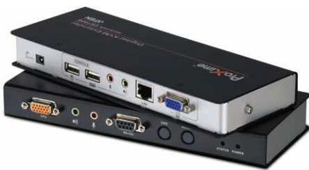
数字KVM信号延长器+音频功能 CE790 x 6